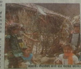
बड़वानी। पोषारोपण करने बाल पंचायत सदस्य।